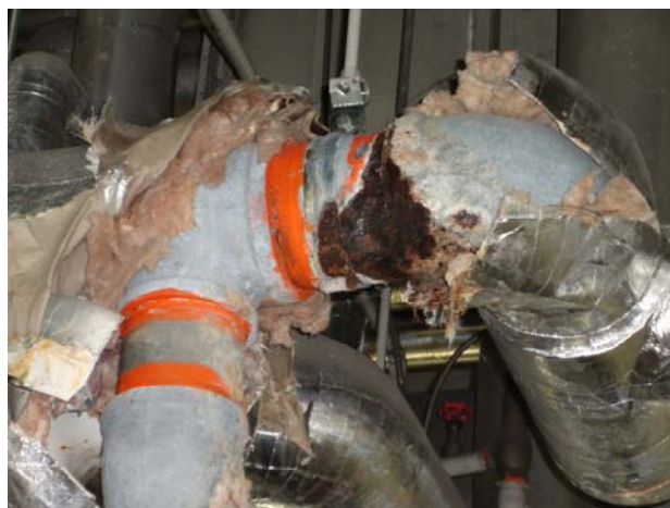
② ボイラー配管破損