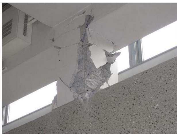
④ 3階トラック天井支柱破損