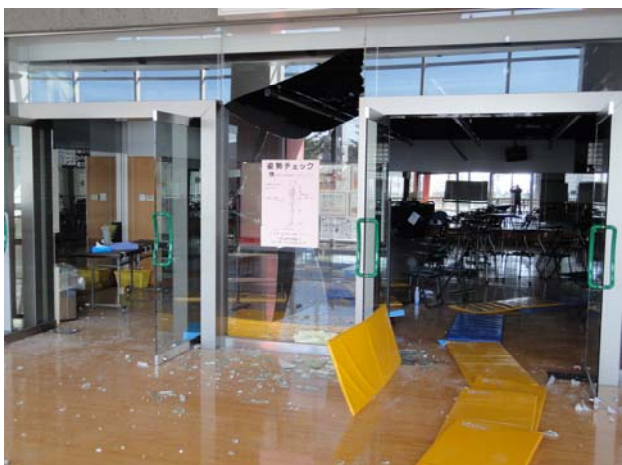
⑤ 3階スタジオガラス破損・天井落下